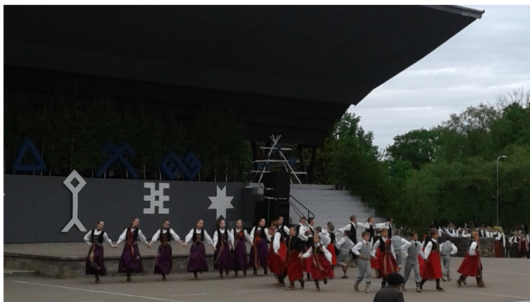
“Lebediks” un “Suitu rausim svētki” 2017